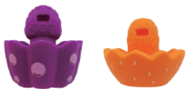
ぶどうカップ オレンジカップ